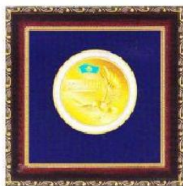
Медаль «ЛИДЕР КАЗАХСТАНА 2013»